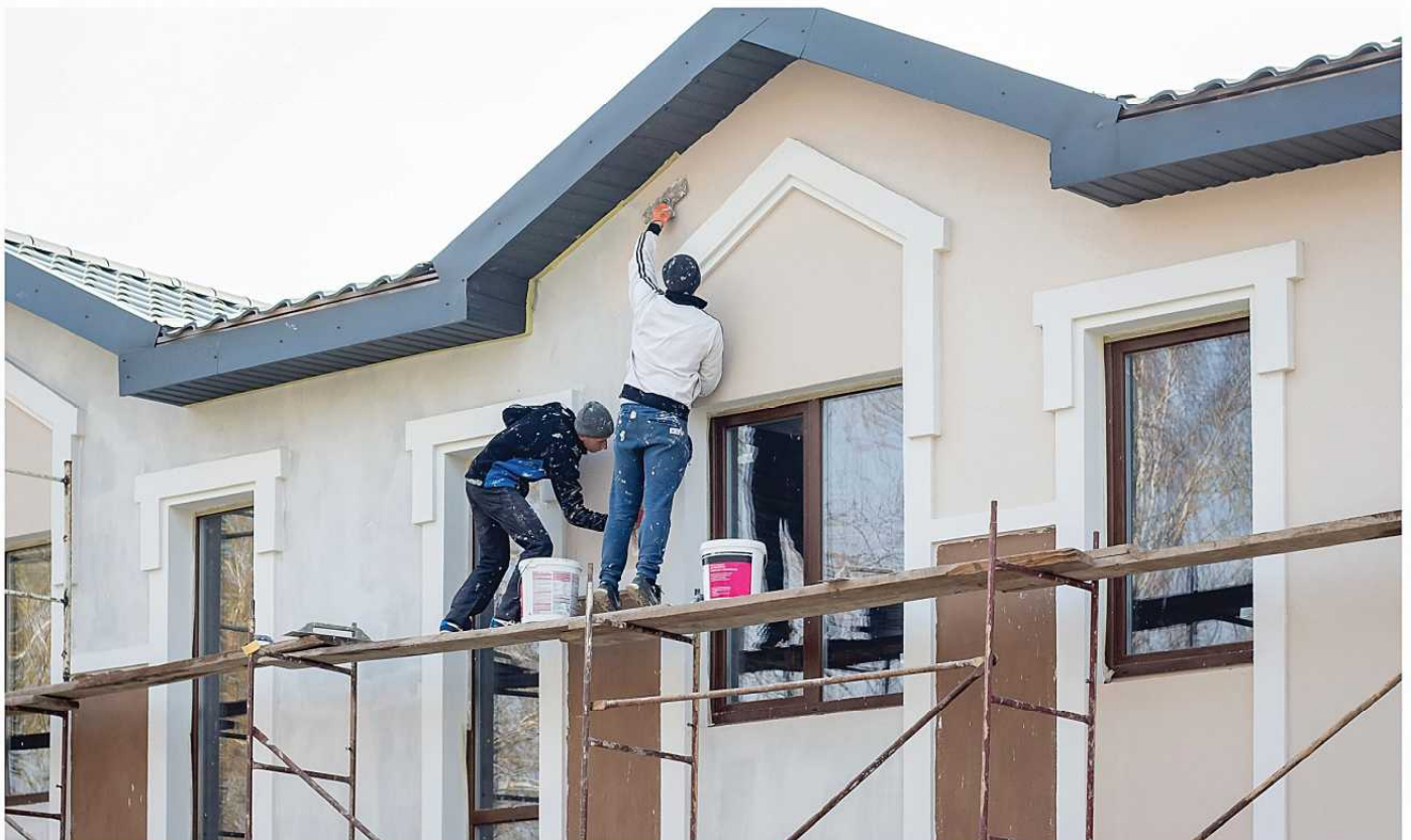
Repairing & Coating